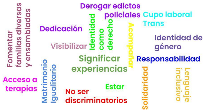
Figura 3. Nube de palabras: logros de las organizaciones en sus años de activismo

Finalmente, a modo de cierre se solicitó a las personas entrevistadas sintetizar objetivos que habían logrado cumplir en su periodo de tiempo de trabajo en la ciudad. Los resultados se presentan en la Figura 3. Por otro lado, se indagó sobre los objetivos a cumplir próximamente, cuáles eran esas deudas pendientes que percibían que tenían con la ciudad y la población lgbt+. Los resultados se encuentran ilustrados en la Figura 4.