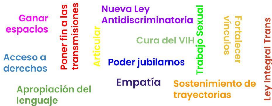
Figura 4. Nube de palabras: pendientes de las organizaciones en sus años de activismo

Se pueden reconocer agrupaciones comprometidas, insertas en el territorio local y sus luchas. Estas labores han permitido un recorrido y logros para la comunidad local, como también desde el apoyo a causas provinciales o nacionales, visibilizando y concientizando. Sin embargo, el compromiso no ha quedado allí, sino que constantemente se piensa en mejores leyes, atención,