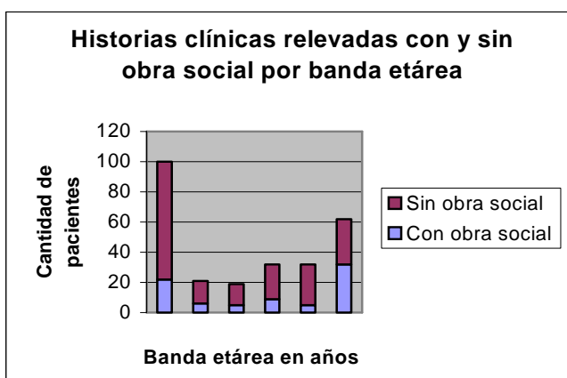
Gráfico 2: Cantidad de pacientes con y sin obra social según la banda etárea.