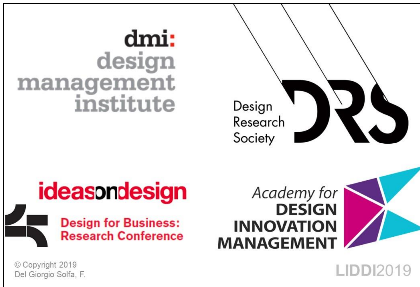
Figura 1. Marco teórico principal

Nota: Esta imagen el marco teórico principal y fue presentada en el Encuentro LIDDI 2019 (Facultad de Artes, UNLP).