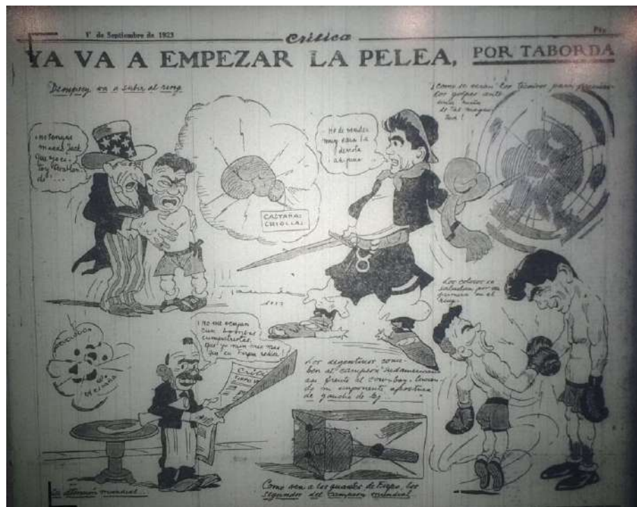
Imagen 7. Crítica [Buenos Aires], set. 14, 1923: 5

Por otro lado, el Tío Sam y Jack Dempsey están aterrizados por la fuerza de las castañas criollas y la brutalidad del coloso de Firpo. A su vez, esta caricatura refleja la importancia que los medios de comunicación locales le daban a la pelea de boxeo, ya que intentaban transmitir que toda la atención del mundo estaba puesta en este evento deportivo, dejando de lado cualquier otro tipo de acontecimiento, hasta la revolución española que se estaba llevando a cabo en el continente europeo.