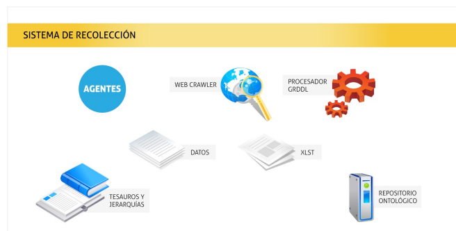
Fig. 1: Sistema de Recolección

La plataforma que aquí se presenta, cuyos componentes se detallan a lo largo de esta sección, se divide en dos grandes sistemas: sistema de recolección y sistema de búsqueda (Fig. 1 y 2). El sistema de recolección tiene como objetivo analizar las paginas web almacenadas en una base de datos y detectar aquellas que están marcadas, extraer su contenido y almacenarlo en una ontología previamente definida para una temática dada, seleccionando términos de un tesauro. El sistema de búsqueda es el encargado de guiar al usuario a realizar una búsqueda inteligente sobre un repositorio que ha sido poblado por el sistema de recolección.