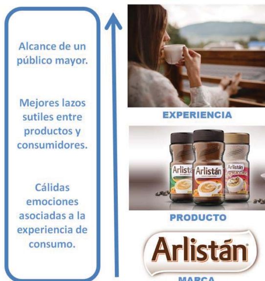
Niveles de acercamiento y vínculos con el consumidor de café. Elaboración propia.

Y que a su vez, esa experiencia sea recordable en el buen sentido y no como una reacción a sonidos y melodías repetidas y pegadizas con las que podría contar un jingle comercial exitoso.