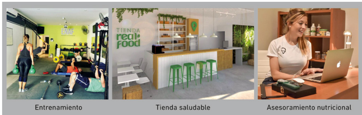
Figura 4. Imágenes del espacio integral.

Una marca de ropa deportiva local, financió la producción de murales artísticos para el interior del espacio y suministra la vestimenta corporativa de entrenadores y empleados, a su vez que ofrece a sus clientes indumentaria con la imagen del ENAF. En cuanto a los alimentos para la tienda, fueron específicamente seleccionados proveedores que sustenten la filosofía saludable. Para ello se seleccionaron productos naturales y de origen controlado, desarrollados por productores locales.