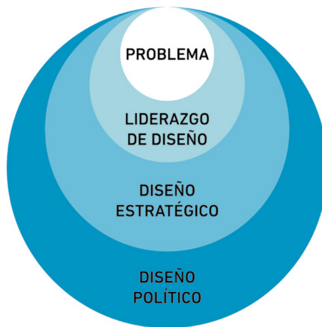
Figura 1. Jerarquía relativa del diseño estratégico.

Es así entonces, que el diseño estratégico se vale de una posición jerárquica que se ubica entre el liderazgo y la política de diseño (Gusakov, 2020). Este enfoque se basa en la selección y ajuste de las variables que debería incluir un proyecto –como pueden ser las tecnológicas, productivas, comunicacionales, de distribución y de uso– para alcanzar un determinado objetivo (Rittel y Webber, 1973).