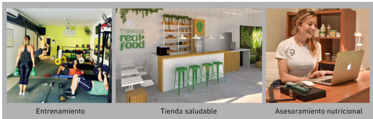
Figura 4. Imágenes del espacio integral.

Una marca de ropa deportiva local, financió la producción de murales artísticos para el interior del espacio y suministra la vestimenta corporativa de entrenadores y empleados, a su vez que ofrece a sus clientes indumentaria con la imagen del ENAF. En cuanto a los alimentos para la tienda, fueron específicamente seleccionados proveedores que sustenten la filosofía saludable. Para ello se seleccionaron productos naturales y de origen controlado, desarrollados por productores locales.