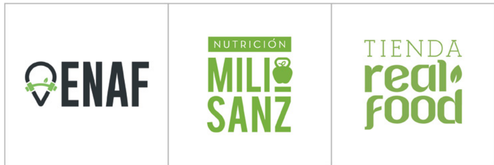
Figura 3. Sistema de identidad visual del centro ENAF.

El diseño y la imagen corporativa ha sido una de las claves en la integración de los diferentes elementos que componen este espacio fitness. Bajo una concepción sistémica se proyectaron las identidades visuales de: ENAF, Nutrición Mili Sanz y Tienda Real Food; consideradas como las tres unidades de negocio principales.