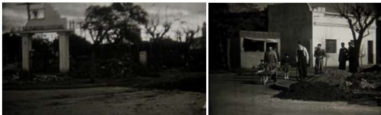
Figuras 5 y 6. Fotogramas de film 16mm blanco y negro, construcción del Club Madero Central en Villa Madero. Camarógrafo anónimo. Circa 1940. El film se encuentra en el archivo de Carlos Torlaschi.

Por otra parte, la popularidad de los noticiarios en los cines (Marrone, 2003), ocasionó que estos comenzaran a cubrir acontecimientos de actualidad de nuestro partido: En este periodo