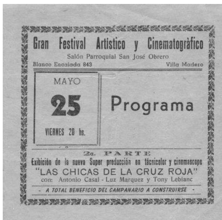
Figura 1. Afiche proyección de cine iglesia San José.