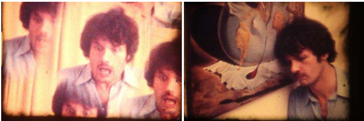
Figuras 8 y 9. Fotogramas del film Súper 8 color “El grito primario”, dirección: Ricardo Rubio. Film propiedad familia Rubio.

Después vino el film “El grito primario” que nunca se dobló (figuras 8 y 9): una temática de un hermano que había abandonado al otro por un conflicto con la novia y no podía superar, e iba al psicólogo, y termina con el grito primario. (R. Rubio, comunicación personal, abril de 2016).