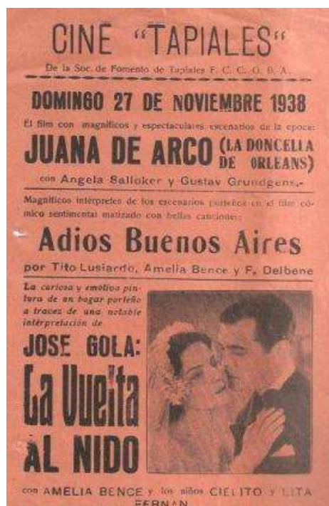
Figura 2. Afiche publicidad Cine Tapiales 1938 que funcionaba en el salón de la Sociedad de Fomento local.

en Tablada, Gran Catan en González Catán, Gran Sele y Gran San Justo en San Justo, Cine Gran Belgrano, Cine Tapiales (ver figura 2), etc.