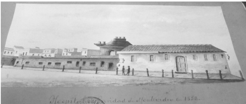
Imagen 2: Fachada del Hospital de Caridad con las habitaciones de la Inclusa. Pintura realizada por Juan Manuel Besnes e Irigoyen en el año 1825. Archivo del Hospital de Caridad de Montevideo 1817-1823. FEAGA. Libro 697. AGN.