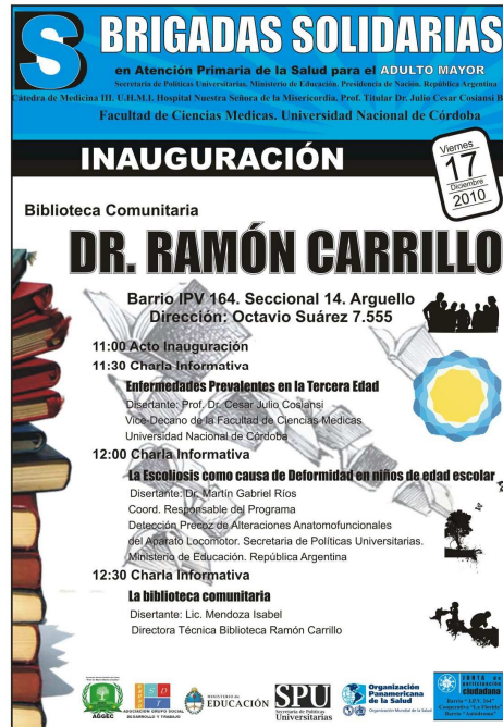
Fig. 2: Afiche de la inauguración de la primera biblioteca comunitaria con orientación en salud (BiCOS) Dr. Ramón Carrillo

Crear bibliotecas no es el problema, sino mantenerlas dentro de una realidad latinoamericana de constantes cambios socio-políticos. A partir de aquí surge el proyecto del voluntariado, en dónde con un diagnóstico previo, se pudieron detectar muchos puntos de conflicto, entre ellos: