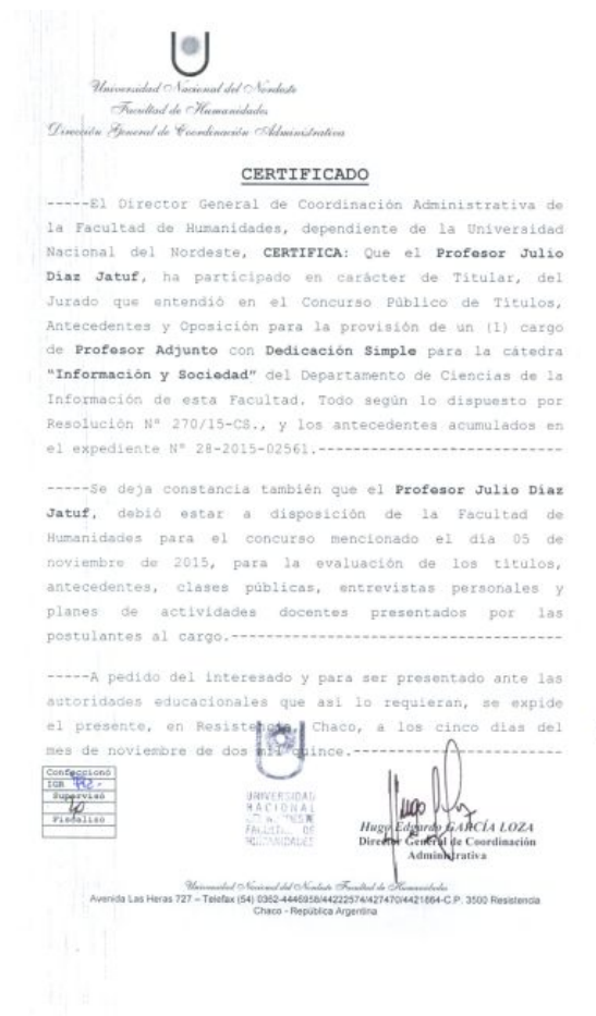
Figura 2: Constancia de participación de la Cátedra CaLiBiSo

Se decide llamar al Director de CaLiBiSo de la Universidad de Buenos Aires, como Jurado, por el área temática a cubrir dentro de la disciplina bibliotecológica. Cumpliendo todo el proceso en este tipo de caso, establecido en la reglamentación y normativa para la toma de concursos docentes.