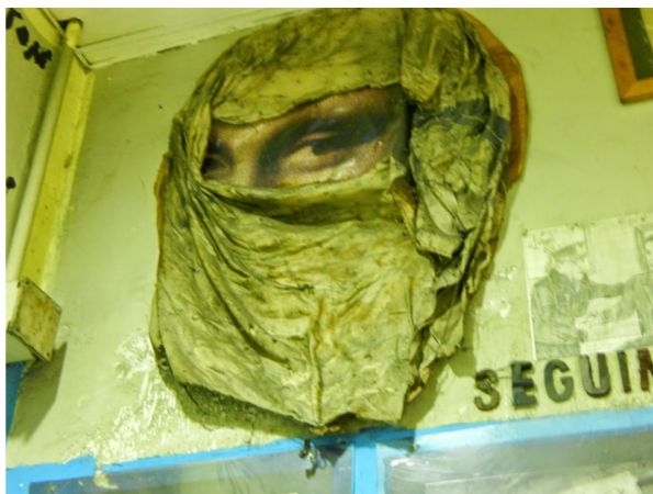
Figura 1. “Gioconda Piquetera”

Jean Jean, M. & Capasso, V. (2013). Gioconda Piquetera [fotografía tomada en la Estación Avellaneda “Darío y Maxi”, Buenos Aires, Argentina].