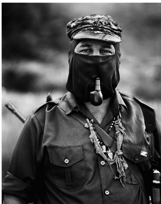
Figura 4. Subcomandante

Entendemos que las imágenes de Bolívar Encapuchado y La Gioconda Piquetera forman parte de un paradigma que la figura del Subcomandante Marcos (y su reciente pasaje al nombre de Subcomandante Galeano), marca como punto de partida acontecimental, tal como lo plantea Agamben (2008), no de singular a universal sino como singularidad que insiste cada vez. La imagen de Marcos habilita en primer lugar una no identificación con un modelo de rostridad, y en segundo lugar, mantiene unida la cabeza al cuerpo, pero un cuerpo que no es individual sino colectivo. Cualquiera puede habitar el pasamontañas de Marcos o Galeano y la pregunta por identificar quién es el líder, qué rostro habita el pasamontañas, remarca la necesidad de identidad policial propia de la máquina de rostridad de la que hablan Deleuze y Guattari. Al igual que en las imágenes de rostros que analizamos, también se da un proceso de equivalencias, aunque más amplio, ya que incluye modelos globales e interculturales.