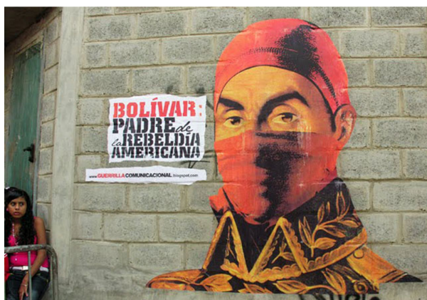
Figura 3. “Bolívar padre de la rebeldía americana”

La siguiente imagen fue difundida por el grupo Guerrilla Comunicacional de Venezuela, un grupo de artistas callejeros que realiza murales. Se observa el rostro encapuchado de Simón Bolívar, pues no sólo se trata de una figura patriótica sino también de un rostro insistente en la iconografía de los movimientos políticos latinoamericanos.