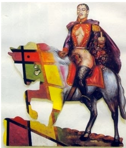
Figura 2. “El libertador Simón Bolívar” Dávila, J. (1994). El libertador Simón Bolívar [pintura postal].

Es importante resaltar que los retratos de Bolívar han estado atravesados por intensos debates, sobre todo en Venezuela. No es casual que el ex presidente fallecido Hugo Chávez, haya realizado para el 24 de julio de 2012, día del nacimiento de Bolívar, un acto donde presentó “el verdadero rostro del padre de la Patria”. Allí, a través de una fundamentación que apelaba a la autoridad de la ciencia, se fundamentaba el “descubrimiento” de la auténtica imagen del prócer latinoamericano. La difusión del nuevo rostro generó diversos debates, ya que cuestionaba la forma canónica de representación de Bolívar y la falta de semejanza con el modelo original. 9 En Chile, la imagen del libertador también ha sido objeto de controversia: en 1994, el artista chileno Juan Domingo Dávila presentó en una instalación de Londres llamada Utopía, una imagen intervenida que presenta a un Bolívar travesti y con rasgos mestizos, mientras realiza el gesto de fuck you . Esta obra repone el problema de la colonialidad y las identidades sexuales subalternas.