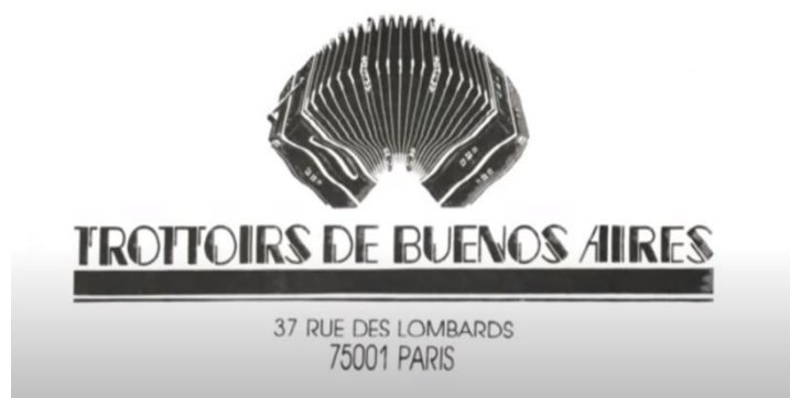
Imagen de Un sueño en Paris

poco pertinente y difícil para el usuario. En cambio, se ha propuesto utilizar cada escena como unidad mínima, ya que se trata de una unidad narrativa que sucede en un único lugar y sin discontinuidades temporales. El número de escenas en una película puede variar entre cuarenta y sesenta, y algunas pueden ser muy breves o muy amplias. Se argumenta que esta unidad es más útil para la recuperación de información. Pese a que en el resumen del contenido de las escenas el uso de los verbos resulta fundamental para apuntar las acciones desarrolladas por los actores en las imágenes, y el de adjetivos para describir las mismas, a la hora de consignar los descriptores, unitérminos o compuestos, se sustantivan los primeros y se acompañan los sustantivos de los segundos, respetando las Directrices para el establecimiento y desarrollo de tesauros monolingües (AENOR, 1995).