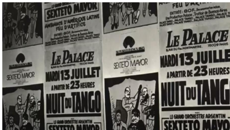
Imagen del film Un sueño en París (Carteleria en francés).

El film expone la repercusión de “Trottoirs” que fue tan grande que todos los artistas argentinos estaban deseosos de presentarse en esta icónica casa de tango tanguería que tuvo su apertura el 20 de noviembre de 1981 y la última función de la Casa de Tanto tuvo lugar el 15 de mayo de 1994. El exilio en Francia durante los años de la dictadura está presente y el documental opta por recuperar una inusual relación entre las veredas de Buenos Aires y aquellas de París, que Cortázar supo explorar en varias creaciones. Hay arte y sensibilidad en Un sueño en París , igual que en el Trattoirs .