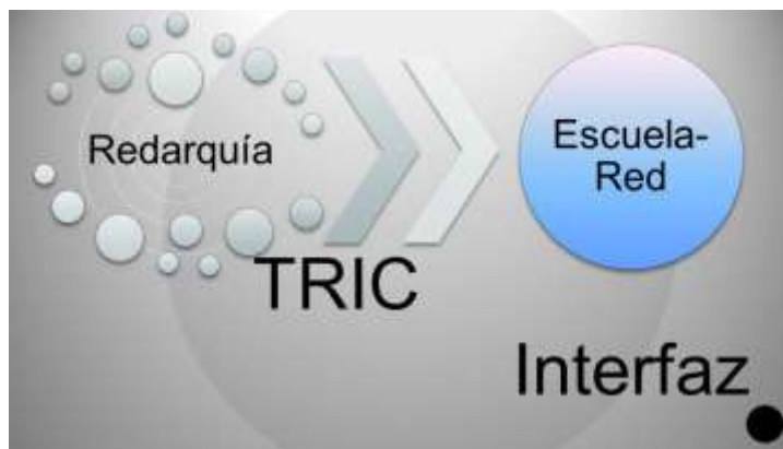
Diagrama N° 3 Interfaz-TRIC-Redarquía (elaboración del autor)

Es posible plantear una conexión entre los conceptos de “Factor Relacional” de Marta-Lazo contenidas en las TRIC (Tecnologías de la Relación, la Información y la Comunicación), el concepto de redarquía de Cabrera desarrollado por Márquez (2009-2011). Precisamente, la ampliación de la idea de interfaz de Carlos Scolari conversa con esquemas de transformación biológica y puede ser utilizada en otras esferas.