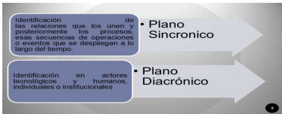
Diagrama N° 2: Actores y Relaciones (Elaborado por el autor en base a las ideas de Scolari, 2019)