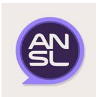
Figura 1: Logo 2016 ANSL

En el año 2016, la ANSL con sus características particulares pasó de ser una empresa periodística gubernamental con grandes recursos a sufrir un proceso de adaptación al nuevo Gobierno liderado por Alberto Rodríguez Saá, quien reemplazó a Claudio Poggi. En diciembre del 2015, el medio pasó a cubrir una menor cantidad de noticias gubernamentales motivado por el cambio de autoridades en el Poder Ejecutivo provincial y los órganos legislativos municipales y provinciales y a una nueva selección de periodistas que realizó el medio que incluyó renovación y finalización de contratos. El cambio de gobernador y del director de la Agencia no generó grandes cambios en la dirección del medio, en sus agendas ni en sus propias coberturas, aunque, con el correr de las semanas, el caudal noticioso gubernamental aumentó progresivamente. En el mes de julio la ANSL cambió levemente su presentación, cambiando el color rojo y por el azul.