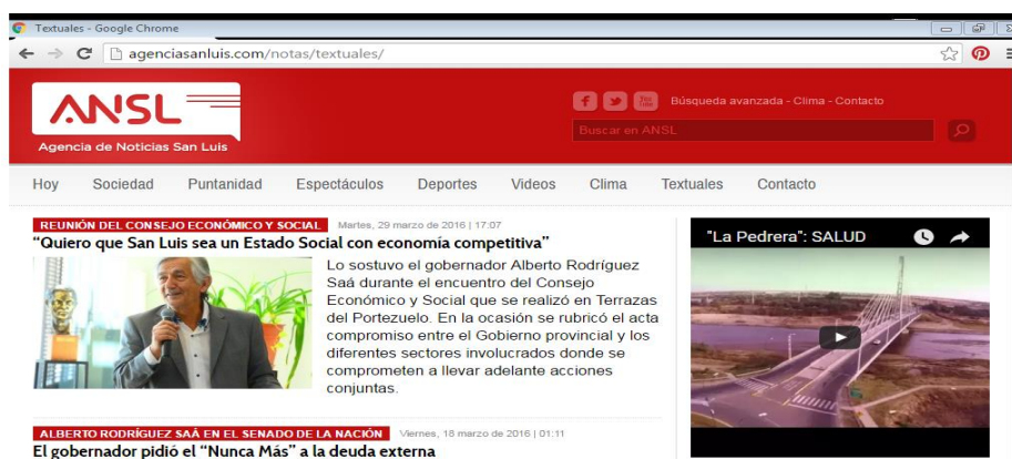
Figura 2: Captura de pantalla Agencia de Noticias San Luis (antes de los cambios) donde aparecen los macrotemas.

En “Textuales” aparecen los videos que expresan el pensamiento y la actividad del actual gobernador de San Luis Alberto Rodríguez Saá ( http://agenciasanluis.com/notas/textuales/ ).