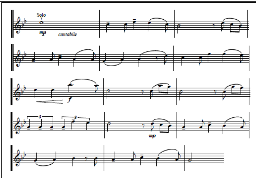
Figura 1. Partitura del solo de violín (compás 168) de Danzón N° 2 utilizado como motivo de trabajo en el estudio.