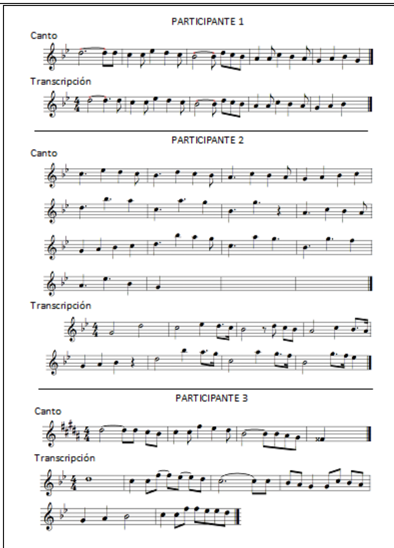
Figura 2. Transcripción de la ejecución cantada de cada uno de los participantes y partituras provistas por los mismos como resultado de la tarea solicitada.