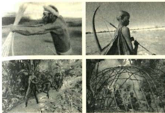
Aún existen grupos que usan técnicas de caza parecidas a las de los antiguos nómadas. Las dos imágenes de la izquierda fueron tomadas en Irán (sobre los nomades) y las del lado derecho son de África, en Namibia (arriba) y en el Congo (abajo). Esta última muestra cómo los pigmeos cobijan ramas para crear refugios en campamentos de caza.