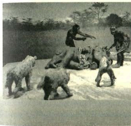
Imagen de cómo podría haber sido la caza por una presa.