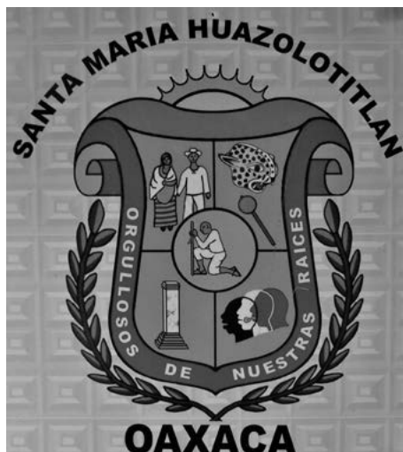
Figura 2. Escudo del municipio de Santa María Huazolotitlán. Fuente: tomado del atril o podio del Ayuntamiento. Fotografía: © Cristina Masferrer (octubre de 2017).

indicó lo siguiente: “Sí, tal vez no lo suficiente; me gustaría que se acepten primero ellos como indígenas y la riqueza que poseen” (talleres realizados por la autora con docentes, 2017).