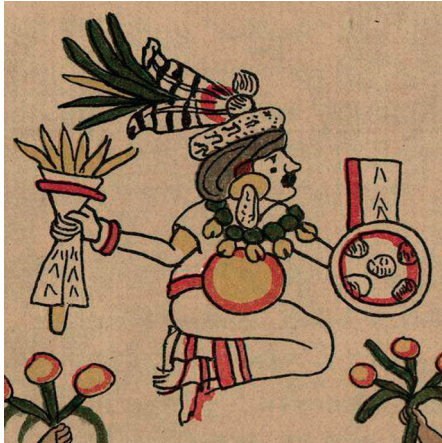
Figura 1. Toci en el Códice Magliabechiano .