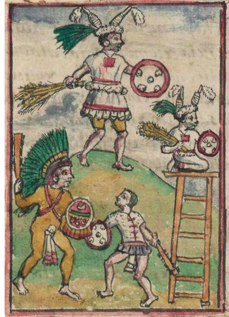
Figura 2. Representación del templo de la diosa Toci según la obra de Diego Durán.

de Sahagún se refiere que en ella se utilizaban a manera de armas, bolsas rellenas de pencas de nopal, por lo que sus características debieron de ser blandas . No obstante, sin querer desestimar dicha propuesta, es necesario considerar que las pencas de nopal no son, a mi parecer, un material que pudiera definirse blando del todo y, por lo que he podido comprobar, tras el análisis del término, éste en realidad se resiste a la traducción, lo cual no resulta extraño en los nombres propios de algunos rituales ya que, en varios de éstos, los nahuas no respetaron las reglas propias de la lengua, quizás debido a que se trataba de términos arcaicos o inclusive fueran préstamos de otros idiomas (véase Díaz Barriga 2021, 70-71).