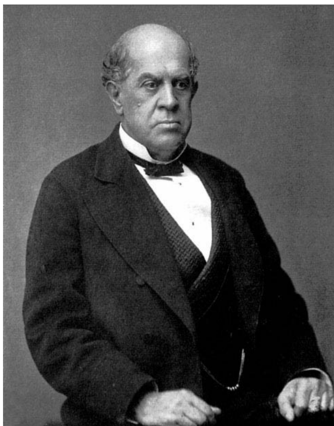
Domingo Faustino Sarmiento