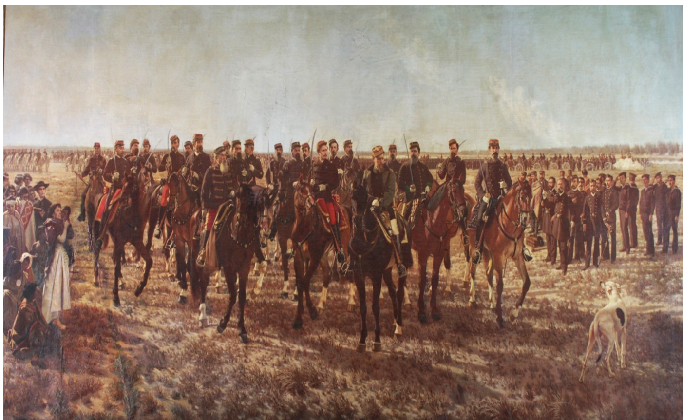
Cuadro "Conquista del desierto" de Juan Manuel Blanes (1889)