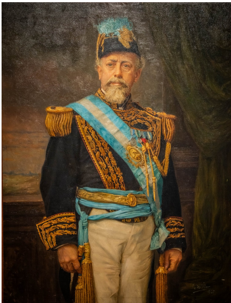
Julio Argentino Roca