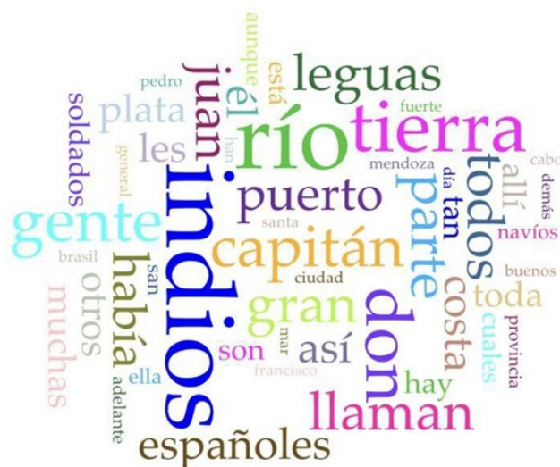
Figura 2. Cirrus del texto. Elaboración propia.

Otro aspecto para considerar a la hora de entender el análisis textual que se puede realizar con Voyant Tools se observa en la gráfica de tendencias de la Figura 3. Esta gráfica nos permite observar la fluctuación de los términos más utilizados a lo largo del manuscrito, y cómo evoluciona su repetición a lo largo del mismo. Este software divide el texto cargado en la plataforma en segmentos que permiten un mejor análisis de dónde y con qué frecuencia se produce la repetición de dichos términos. En el gráfico de la figura 3 podemos observar cómo la palabra más repetida en el manuscrito ( indios ) tiene una frecuencia relativa similar a las de los otros términos a lo largo de todo el manuscrito, mientras que don , destaca por encima del resto de los términos en un segmento en particular del texto.