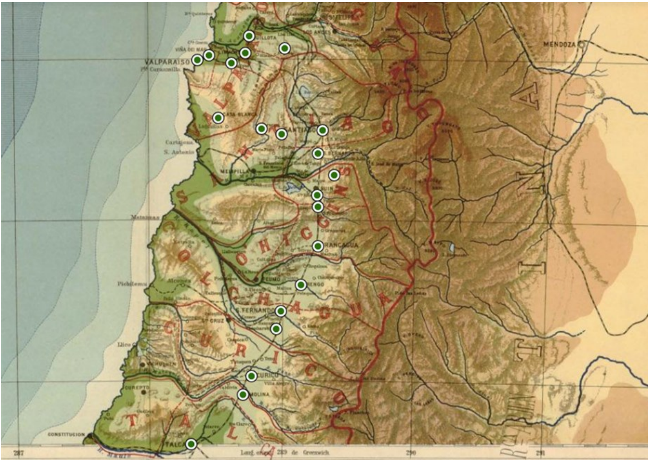
Figura 3. Georreferenciación de un tramo del viaje de Rankin sobre territorio chileno, realizado por Recogito en base a la imagen de un mapa levantado a comienzos del siglo XX.

A pesar de lo dicho, en algunos momentos la búsqueda de los lugares por los que pasó Rankin se volvió algo complicada, en especial sobre el territorio chileno, cuya toponimia no tiene una cobertura tan completa de gazetteers como en otras regiones de América. Sin embargo, Recogito permite elegir un marcado manual y sortear así este inconveniente. Además, da la opción de trabajar sobre cartografías externas al mapa preestablecido, alternativa que en mi caso fue de gran utilidad justamente porque facilitó la búsqueda y marcado de lugares específicos.