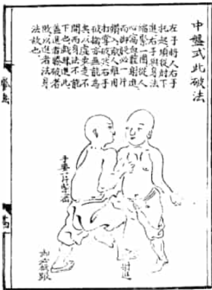
Diagrama del “Cannon Shaolin de Golpe Corto” sobre la entrada directa.

La rotación o movimiento pendular de la cadera, aporta aceleración e introduce la fuerza de los músculos abdominales y lumbares, de ahí que para un estilo de combate “corto” y “pegajoso”, es elemental saber emplear y colocar de manera adecuada la cadera, además del correcto sentido de la masa, inercia y fuerza; por ello el texto clásico señala que “La mano desde el centro; el puño se lanza desde el corazón” ; “Un núcleo fuera de control significa que uno está fuera de control. Inclinar y pegar el cuerpo a la pierna y el brazo del oponente para detectar, preparar, controlar y atacar ...” .