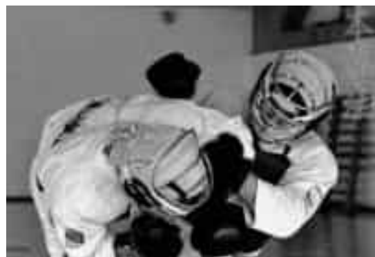
Ejemplos de combate de corta distancia en el Muay Thai (izquierda) y Nippon Kempo (derechs).

La “potencia” es una noción relevante para la realización del “ impulso ”, esta se basa primordialmente en la Segunda Ley de Newton que tiene relación directa con el producto de la masa de un cuerpo por la aceleración que desarrolla o se le imprime mediante una fuerza externa o interna.