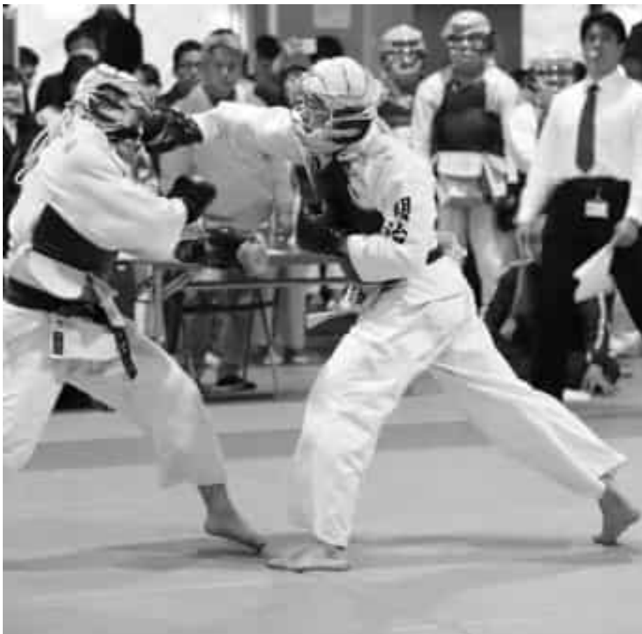
Golpe de Nippon Kempo en el que se aprecia la biomecánica del impulso y “dejar ir”

Cuando se recibe la energía cinética de la reacción generada en el tren inferior, esta se acumula en el centro de gravedad y es fundamental “soltar” ( sung ), “dejar ir” el impulso concentrado potencializándolo con el giro de la cadera y los músculos del núcleo.