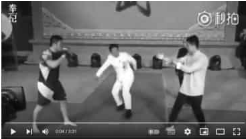
Imagen de la postura de guardia de un practicante de Wing Chun (derecha) y un peleador de MMA (izquierda) en una situación de combate real.

En la imagen de abajo, se observa como el practicante de “Wing Chun” (derecha) mantiene su centro de gravedad retrasado enfocado en la estructura, mientras que el peleador de MMA (izquierda) conserva una postura compacta cargada hacia el frente y con la posibilidad de realizar desplazamientos rápidos si lo requiere. La postura de guardia del representante de MMA es muy similar a la señalada en el “ Canon Shaolin de Golpe Corto ” presentada en un capítulo anterior.