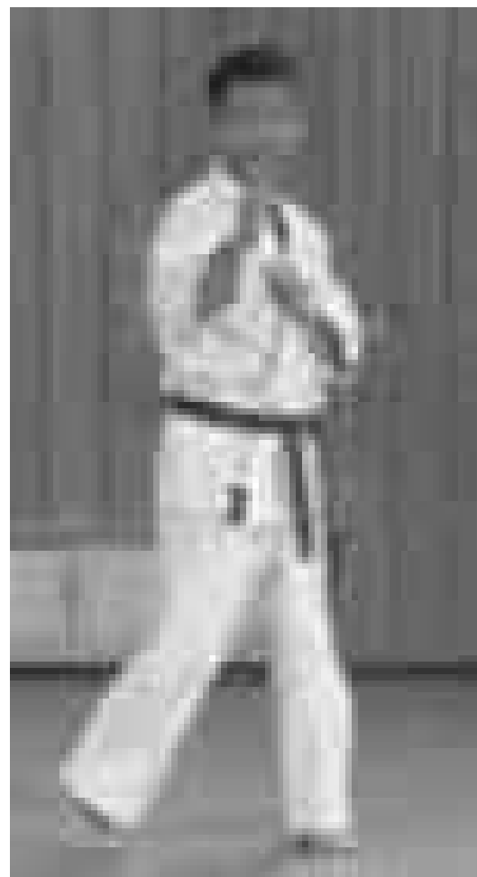
Ejecución de Shomen Tsuki de Nippon Kempo.