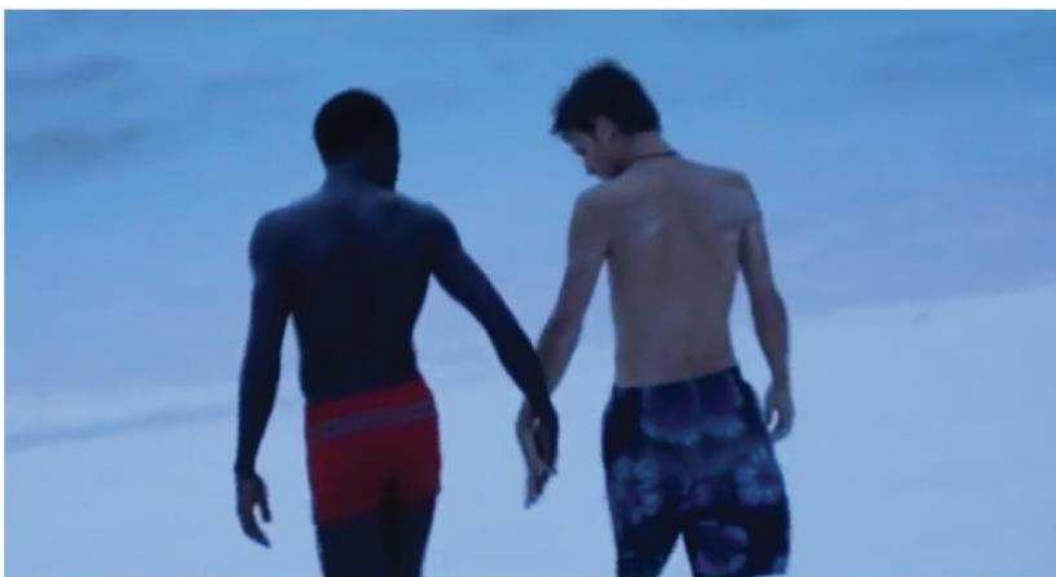
Figura 4: 1:39:56

Para o Laughlin (2010), o filme retrata a intersecção de sexualidade e raça nas Bahamas: a cor branca é percebida como pervertida (homossexual), e a negra não. Romeo tenta dar a mão a Johnny (23':24''; 30':30'') em sinal de companheirismo, mas este repele o gesto: a pessoa branca e educada (Johnny é pintor e estudante universitário) desconfia da pessoa negra que anteriormente se envolveu em pequenos furtos (23':33''). A reconciliação nacional associada às mãos dadas no sonho de Johnny aparece no final do filme, na cena do sonho. Mas o racismo não ganhou detalhes ao longo do filme. Antes de morrer Johnny sonha que sobrevive, nesse momento Romeo lhe estende a mão, e o filme termina com os dois jovens de mãos dadas no paraíso imaginário da vítima.