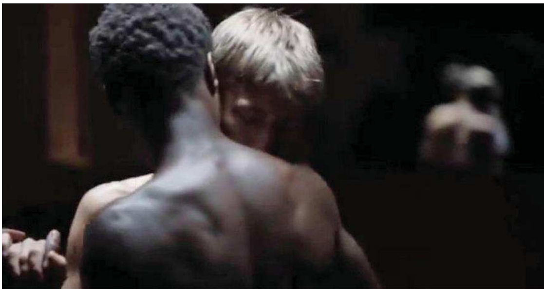
Figura 6: 59:59

O argumento de Beatriz Preciado investe nas ideias de Michel Foucault em História da sexualidade I , onde se diz que a incitação ao discurso sobre sexo é parte do dispositivo da sexualidade, dispositivo inventado no decorrer do século dezanove: o poder produz corpos e desejos (PRECIADO, 2009, p. 136). Os saberes da história da medicina existem além das pesquisas de Foucault. O tema da invenção do sexo tem variações feitas a partir de dados e autores distintos. Foucault estudou a sexologia e a psiquiatria do século dezanove, por outro lado, Thomas Laqueur investigou especificamente a produção dos anatomistas entre 1600 até 1800, os textos médicos que descrevem o corpo humano. Laqueur alega que existiram pelo menos dois grandes modos de ler o corpo: 1) o modelo do sexo único, neste modo o masculino é a versão definitiva e madura do humano, e o corpo feminino é interpretado como a versão inferior ou infantil do modelo masculino; no século dezesseis havia “um corpo canônico e esse corpo era macho” (2001, p. 16, 89, 91); 2) no modelo dos dois sexos há dois tipos de corpos, o dimorfismo sexual é explícito: “No final do século XVII e ao longo