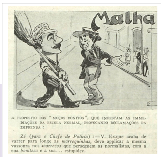
Figura 2. «Malhadelas»

Del mismo modo, en la nota «Os “moços bonitos” e as suas graças» [Los “mozos bonitos” y sus gracias], publicada en la sección de denuncias de Jornal do Brasil el 15 de diciembre de 1915, se reprochan las «gracias pesadas a las señoras o señoritas» y se pide la intervención de la autoridad policial (p. 9).