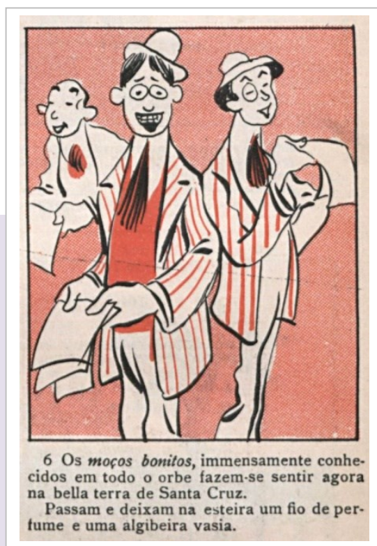
Figura 1. Guignol. Invasões no Brasil [Invasiones en Brasil]. O Malho , 07/12/1907, p. 7.

En diciembre de 1907, en la revista carioca O Malho , el caricaturista Guignol había retratado varias novedades, y, del mismo modo que con inmigrantes, sacerdotes, proxenetas y cinematógrafos, alegó que los «mozos bonitos» eran parte de las transformaciones de Río de Janeiro, ampliamente reconocidas. Gracias a la leyenda que acompaña la ilustración (p. 7), se entiende que los representa como estafadores [Figura 1].