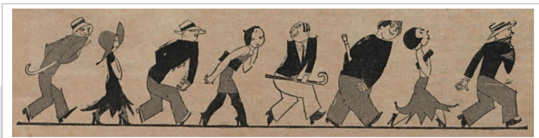
Figura 3. Os moços bonitos [Los mozos bonitos]. O Malho , 07/03/1931, p. 3.

En esta forma de hablar, los mozos bonitos no sirven para conquistar muchachas y jovencitas que saben cuidar de sí mismas.