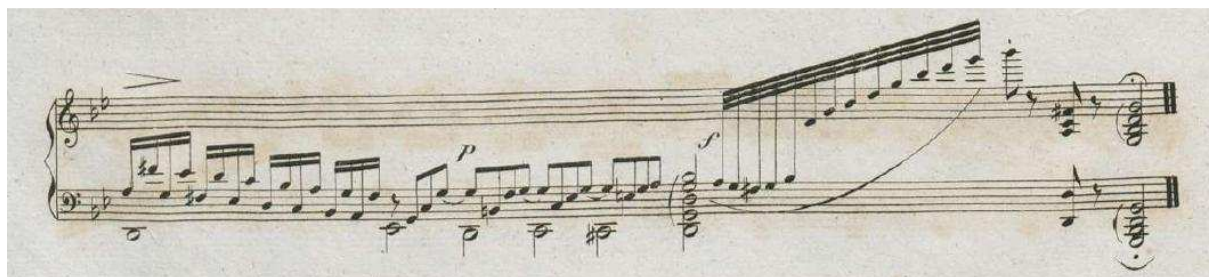
Figura 3, “Vingt-Six PRÉLUDES (...)”, 15° Prélude in G moll, final do compasso 1: escrito como uma pequena cadenza (CRAMER, s.d.).

Como se pode notar na Figura 4, os prelúdios que Cramer usa no Introduction são mais estruturados ritmicamente; neste caso também se destaca seu pouco interesse melódico, que contrasta com o caráter cantábile da música que o segue ( Plaintive ):