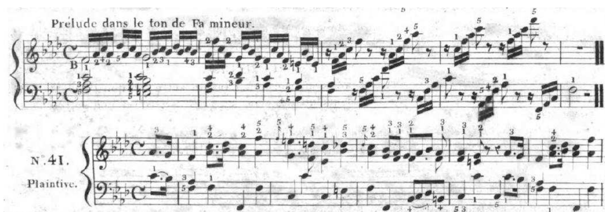
Figura 4, “Prélude dans le ton de Fa mineur”; “N o . 41. Plaintive.”: desenhos imutáveis de semicolcheias no prelúdio (CRAMER, 1810, p. 40).

Como se pode notar na Figura 4, os prelúdios que Cramer usa no Introduction são mais estruturados ritmicamente; neste caso também se destaca seu pouco interesse melódico, que contrasta com o caráter cantábile da música que o segue ( Plaintive ):