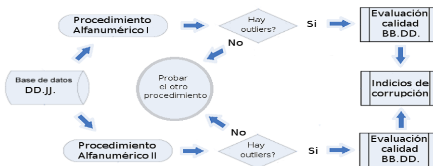
Fig. 4. Propuesta de aplicación de procedimientos híbridos de detección de campos anómalos sobre bases de datos de declaraciones juradas alfanuméricas.[Elaboración propia]

La idoneidad de estos procedimientos híbridos son propuestos como solución tentativa para un caso de contralor civil para la mejora de los datos públicos y cívicos de una población. A continuación se despliega una posible resolución y aplicación hipotética de contralor civil en base a los procedimientos alfanuméricos descriptos, sobre BBDD de DDJJ abiertas previamente tratadas.