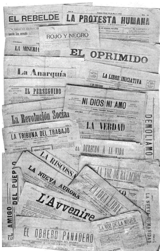
Los periódicos anarquistas. Caras y Caretas , Buenos Aires, 11/08/1900.

vinculas a puertos, que eran el nexo vital entre la producción agropecuaria y su salida a ultramar.