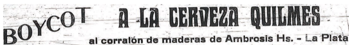
Sócalo en La Protesta incitando al boicot, 03/01/1907.

La debilidad en que cayó la FOLR se manifestó evidente cuando a fines de aquel año una huelga de inquilinos estalló en Buenos Aires. La misma fue replicada en Rosario, siendo dirigida y abrigada por la FOLR y sus sedes gremiales afines. Lejos de constituir un éxito en términos de lucha, la FOLR salió debilitada, la huelga no logró más que retrasar el pago de los altos alquileres que no lograron erradicar, y finalmente su pretendida participación en la huelga general nacional decretada para enero próximo fue rápidamente desbaratada por la policía, la cual detuvo a numerosxs militantes días antes de la misma.