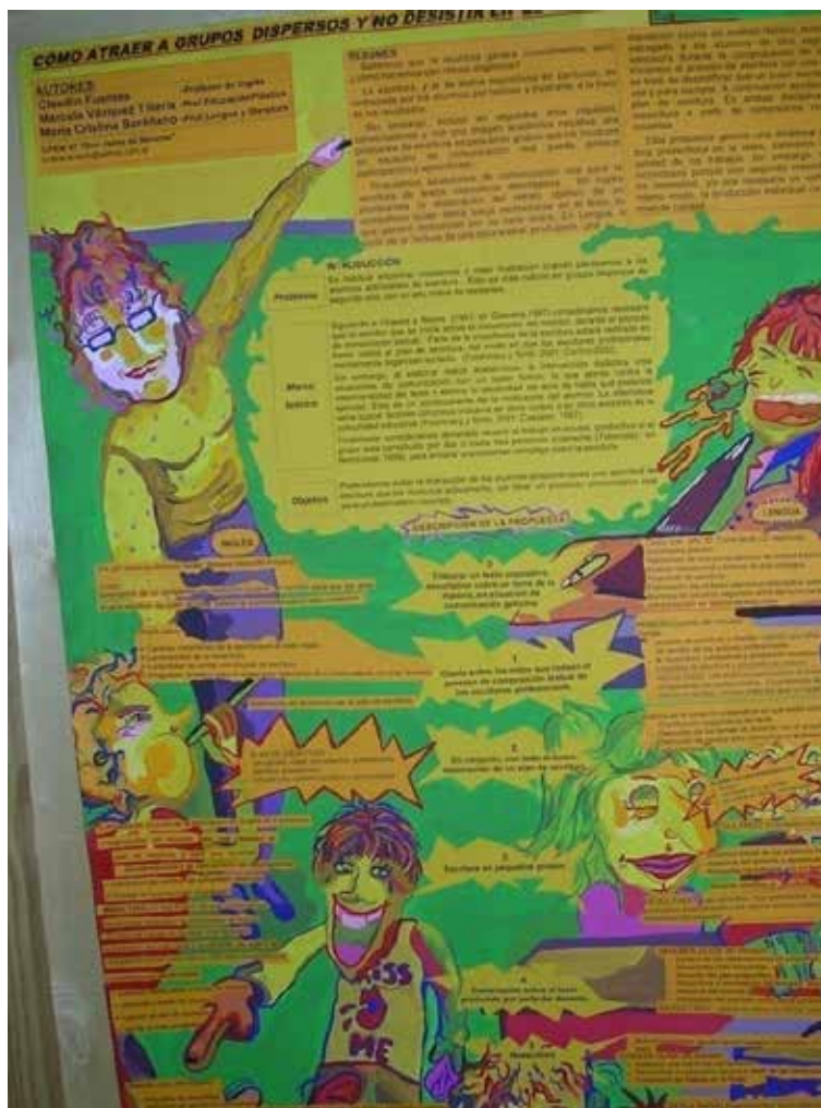
Figura 6. Fotografía de poster presentado en jornada abierta

Así, al cabo del primer año, organizamos una jornada abierta con presentación de pósters, en los cuales los docentes (de Historia, Geografía, Química, Inglés, Lengua, etc.) describieron y analizaron sus experiencias al integrar la lectura y escritura en sus clases a través del currículum (Figuras 6 a 8). Esta presentación generó tal entusiasmo en buena parte de los docentes participantes se organizaron para viajar y participar, con estos posters, en un congreso educativo que se realizó a 1000 kilómetros de distancia, en la ciudad de Tandil. En ese congreso, además de presentar sus posters, tuvieron ocasión de escuchar a una conferencista uno de cuyos libros había sido leído y discutido durante la formación. Era la primera vez que muchos de estos docentes asistían a un congreso, y la experiencia de hacerlo conjuntamente afianzó la comunidad y el compromiso.