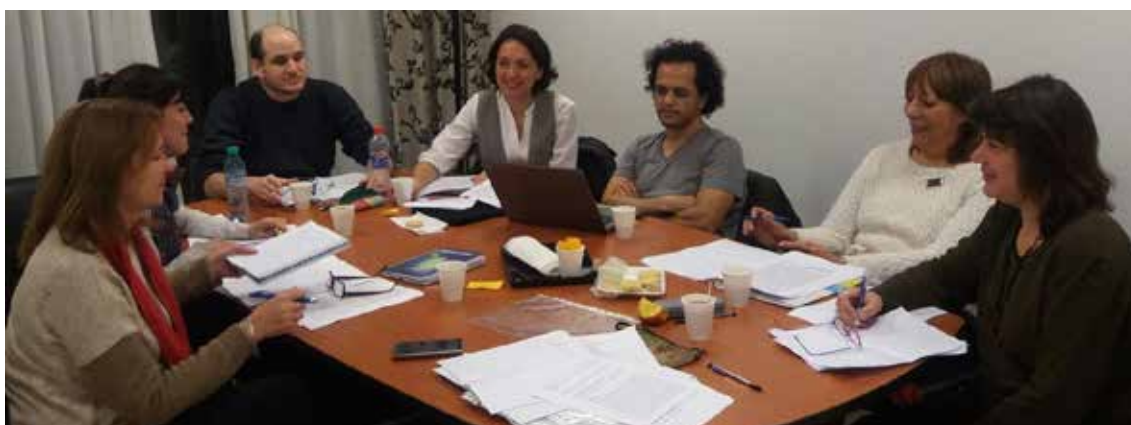
Figura 2: Reunión GICEOLEM en la Universidad Pedagógica Nacional

En la Figura 2 puede observarse una instancia similar a la Figura 1: la fotografía muestra que estamos reunidos en la Universidad Pedagógica Nacional en un trabajo de diálogo sobre avances de investigación que ponemos por escrito (interpretación de observaciones de clase, material de entrevistas para analizar, abstracts de posibles ponencias que pretendemos enviar a congresos, borradores de capítulos de tesis o de artículos, etc.).