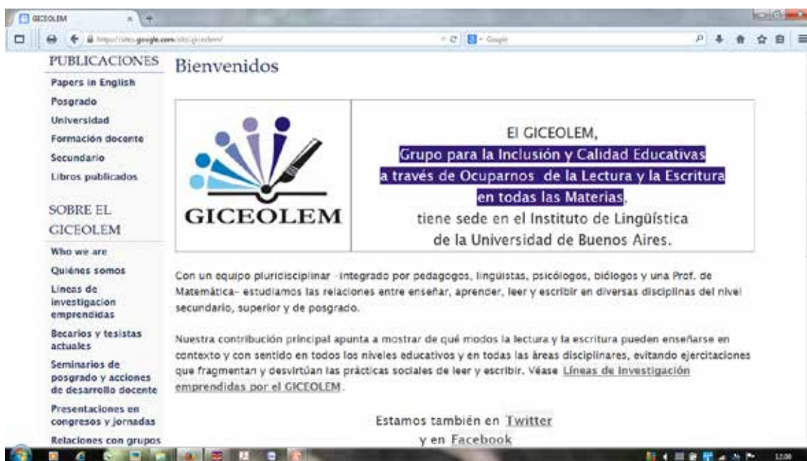
Figura 3. Captura de pantalla de la página de inicio del sitio del GICEOLEM en internet: https://sites.google.com/site/giceolem/

En la Figura 3 aparece el logo de nuestro grupo. Y lo comento porque acabo de percatarme de que nuestro logo y el logo de este Encuentro (Asesorías Pedagógicas Universitarias), reproducido en la Figura 4, tienen algo en que se parecen y algo en que se diferencian. Infero que cada uno apunta a algo pertinente al tema de esta charla que el otro logo desatiende. Observen ambos unos instantes y, al final de mi presentación, podremos retomar lo que tienen en común y aquello en lo que difieren.