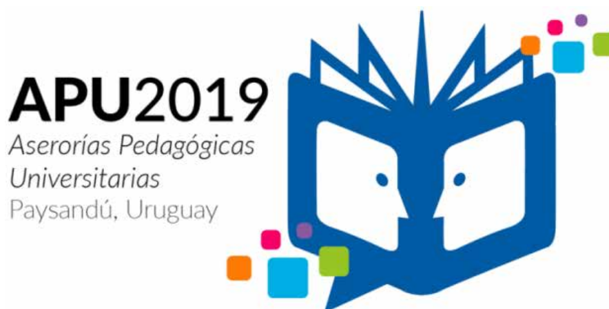
Figura 4. Logo del Encuentro de 2019 de Asesorías Pedagógicas Universitarias.

En la Figura 3 aparece el logo de nuestro grupo. Y lo comento porque acabo de percatarme de que nuestro logo y el logo de este Encuentro (Asesorías Pedagógicas Universitarias), reproducido en la Figura 4, tienen algo en que se parecen y algo en que se diferencian. Infero que cada uno apunta a algo pertinente al tema de esta charla que el otro logo desatiende. Observen ambos unos instantes y, al final de mi presentación, podremos retomar lo que tienen en común y aquello en lo que difieren.