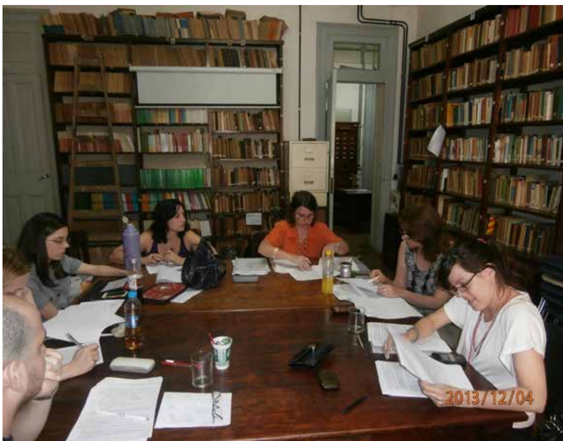
Figura 1: Reunión GICEOLEM en la Biblioteca del Instituto de Lingüística de la Universidad de Buenos Aires

de nuestra producción, en el que la intersubjetividad pone a prueba permanentemente nuestro pensamiento construido mediante lo escrito. Los comentarios que hacemos a los “textos borradores” presentados objetan esbozos endebles, señalan lagunas, advierten incongruencias, sugieren ideas enriquecedoras, brindan formulaciones alternativas más cautelosas, o, por el contrario, más asertivas y que ayudan a sacar brillo a algún resultado que vale la pena, etc.