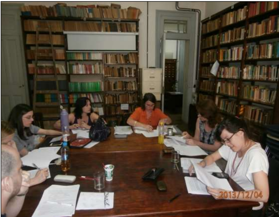
Figura 1: Reunión GICEOLEM en la Biblioteca del Instituto de Lingüística de la Universidad de Buenos Aires

mucho antes de hacer pública la escritura forma parte de un dispositivo de reflexión sobre las ideas en curso y sobre la forma de expresarlas. Revisar recurrentemente ambas cosas (contenidos y formas) ayuda a gestar publicaciones más elaboradas que si la escritura hubiera sido solo el paso final. Me gusta pensar que este dispositivo de revisión colectiva durante todo el proceso de nuestras investigaciones constituye un mecanismo de “depuración”, de refinamiento de nuestra producción, en el que la intersubjetividad pone a prueba permanentemente nuestro pensamiento construido mediante lo escrito. Los comentarios que hacemos a los “textos borradores” presentados objetan esbozos endebles, señalan lagunas, advierten incongruencias, sugieren ideas enriquecedoras, brindan formulaciones alternativas más cautelosas, o, por el contrario, más asertivas y que ayudan a sacar brillo a algún resultado que vale la pena, etc.