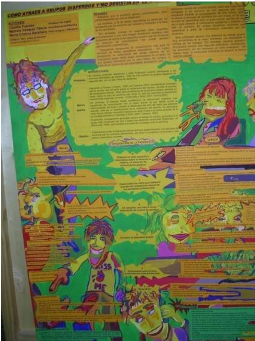
Figura 6. Fotografía de poster presentado en jornada abierta