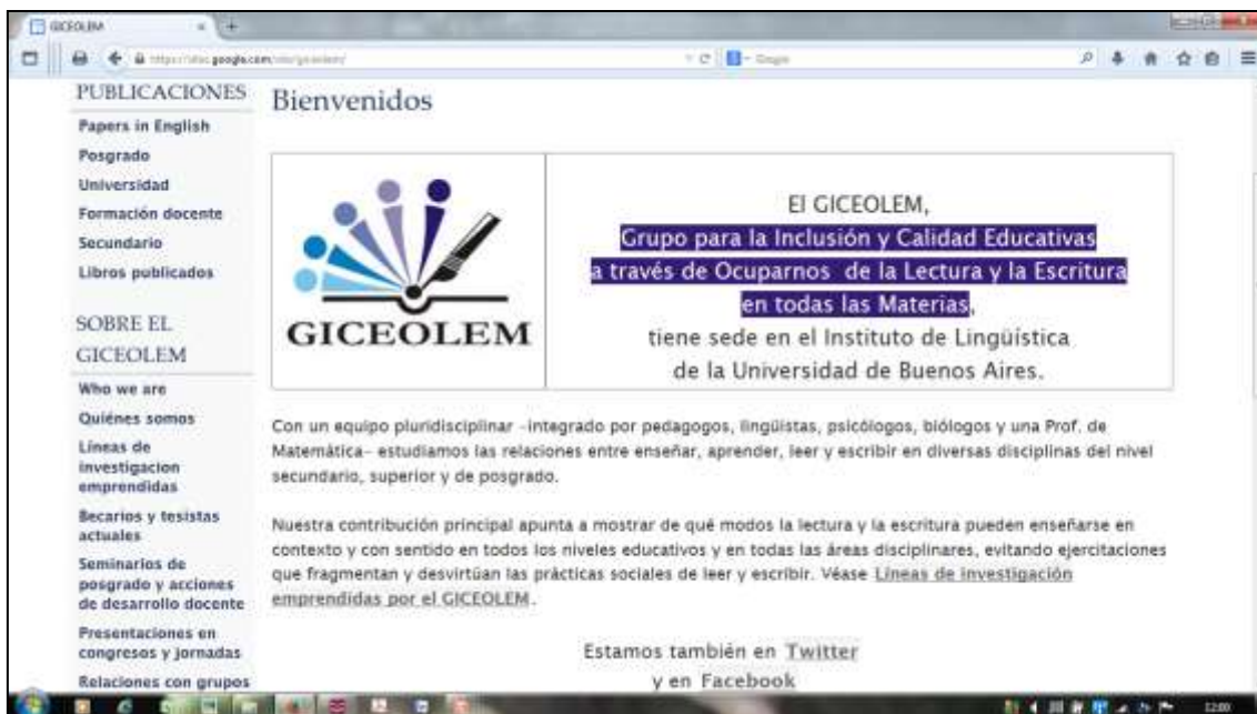
Figura 3. Captura de pantalla de la página de inicio del sitio del GICEOLEM en internet: https://sites.google.com/site/giceolem/

grupo, en qué congresos participamos, qué talleres impartimos; podrán acceder a videos de nuestras charlas, etc.