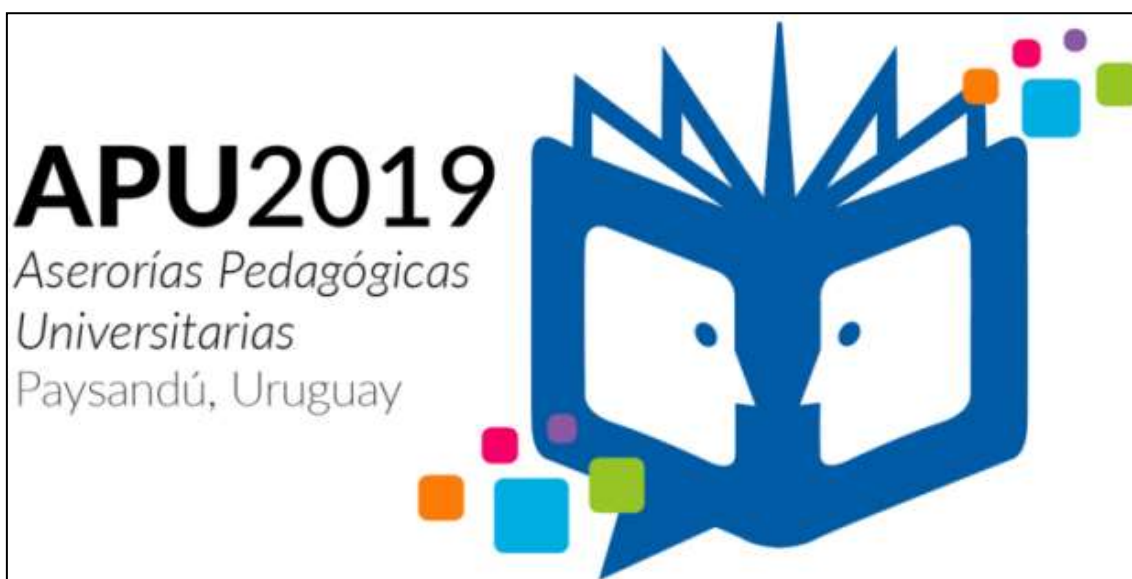
Figura 4. Logo del Encuentro de 2019 de Asesorías Pedagógicas Universitarias.

En la Figura 3 aparece el logo de nuestro grupo. Y lo comento porque acabo de percatarme de que nuestro logo y el logo de este Encuentro (Asesorías Pedagógicas Universitarias), reproducido en la Figura 4, tienen algo en que se parecen y algo en que se diferencian. Infero que cada uno connota un aspecto pertinente sobre el tema de esta charla, que el otro logo desatiende. Observen ambos unos instantes y, al final de mi presentación, podremos retomar lo que tienen en común y aquello en lo que difieren.