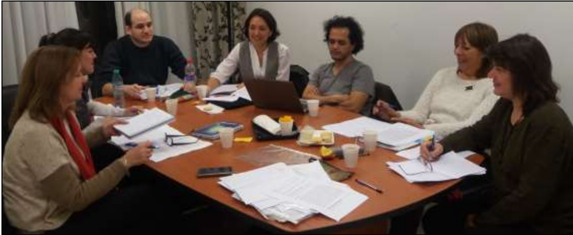
Figura 2: Reunión GICEOLEM en la Universidad Pedagógica Nacional

En la Figura 2 puede observarse una instancia similar a la Figura 1: la fotografía muestra que estamos reunidos en la Universidad Pedagógica Nacional en un trabajo de diálogo sobre avances de investigación que ponemos por escrito (interpretación de observaciones de clase, material de entrevistas para analizar, abstracts de posibles ponencias que pretendemos enviar a congresos, borradores de capítulos de tesis o de artículos, etc.).