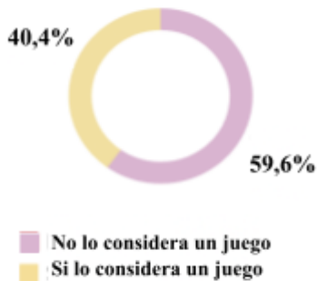
Gráfico N°1: La actividad “uso del celular, computadora, tablet y otros dispositivos digitales” ¿es considerada un juego?