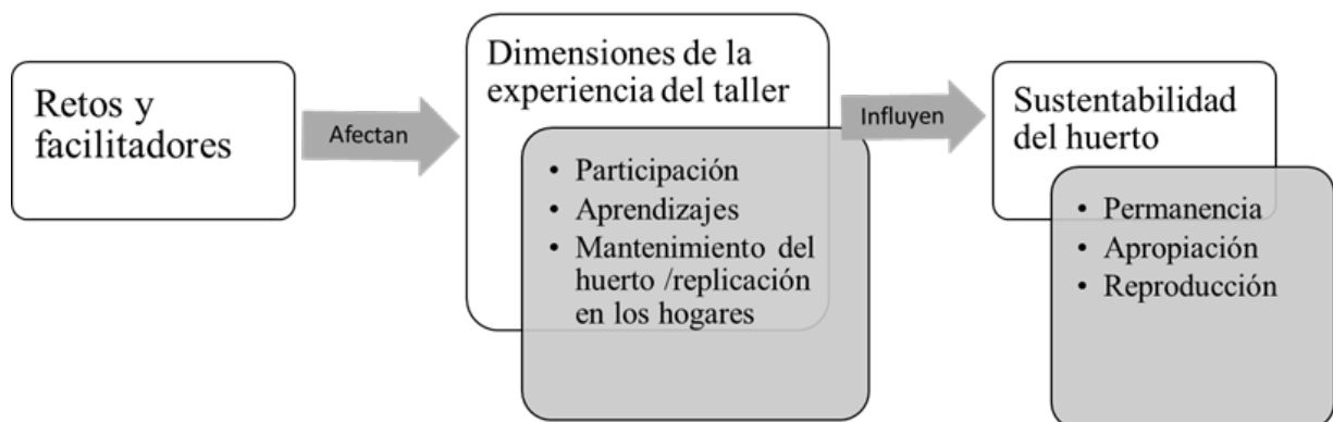
Figura 2. Esquema de relación entre retos y facilitadores, dimensiones de la experiencia del taller y la sustentabilidad del huerto en Xoxocotla, Morelos.

A continuación, describimos los retos y facilitadores más relevantes.