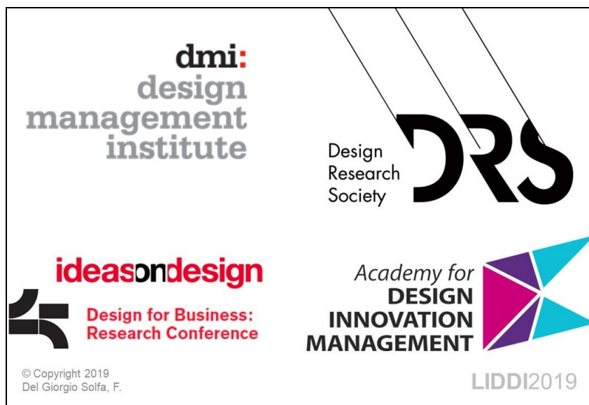
Figura 1. Marco teórico principal

Nota: Esta imagen el marco teórico principal y fue presentada en el Encuentro LIDDI 2019 (Facultad de Artes, UNLP).