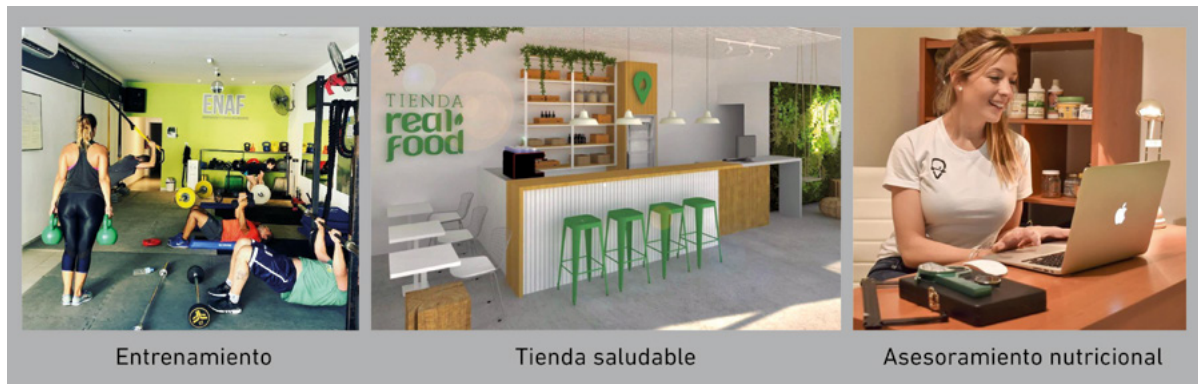
Figura 4. Imágenes del espacio integral.

Una marca de ropa deportiva local, financió la producción de murales artísticos para el interior del espacio y suministra la vestimenta corporativa de entrenadores y empleados, a su vez que ofrece a sus clientes indumentaria con la imagen del ENAF. En cuanto a los alimentos para la tienda, fueron específicamente seleccionados proveedores que sustenten la filosofía saludable. Para ello se seleccionaron productos naturales y de origen controlado, desarrollados por productores locales.