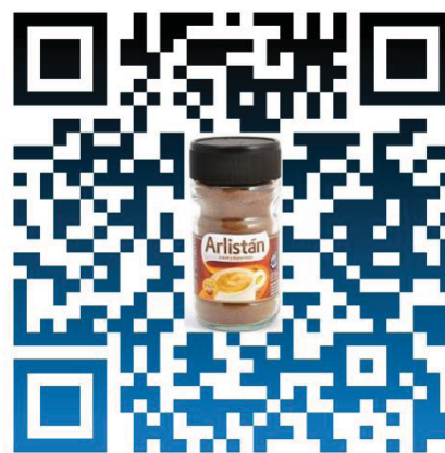
Código QR de Canciones Arlistán con el frasco de café. Elaboración propia.

La propuesta más viable para conseguir que las canciones estén en el frasco de café instantáneo Arlistán, es el agregado de un sticker con el código QR que sirva como nexo digital a las canciones, las que podrían escucharse en sus Smartphones a través de las aplicaciones multiplataforma Spotify o SoundCloud .