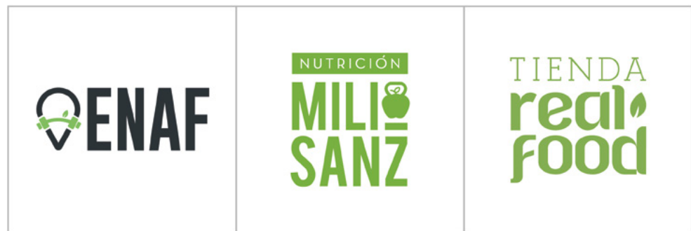
Figura 3. Sistema de identidad visual del centro ENAF.

El diseño y la imagen corporativa ha sido una de las claves en la integración de los diferentes elementos que componen este espacio fitness. Bajo una concepción sistémica se proyectaron las identidades visuales de: ENAF, Nutrición Mili Sanz y Tienda Real Food; consideradas como las tres unidades de negocio principales.