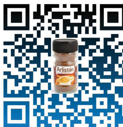
Código QR de Canciones Arlistán con el frasco de café. Elaboración propia.

La propuesta más viable para conseguir que las canciones estén en el frasco de café instantáneo Arlistán, es el agregado de un sticker con el código QR que sirva como nexo digital a las canciones, las que podrían escucharse en sus Smartphones a través de las aplicaciones multiplataforma Spotify o SoundCloud .