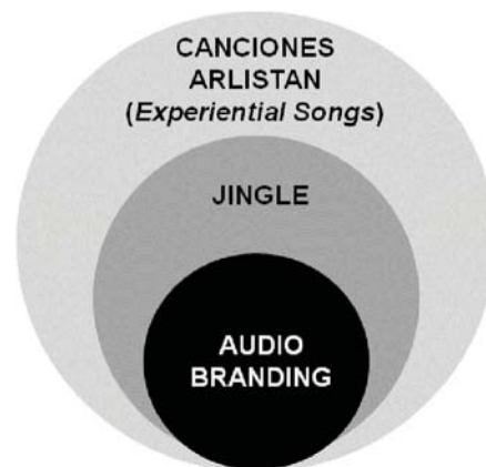
Categorización publicitaria de las canciones Arlistán. Elaboración propia.

branding , están destinadas a crear lazos sutiles entre productos y consumidores 172 .