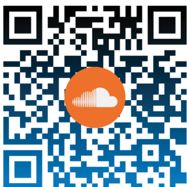
Código QR de Canciones Arlistán con el logo de SoundCloud. Elaboración propia.

La experiencia que se busca alcanzar, solo se logra cuando la degustación del café se produce junto al complemento musical propuesto, en un entorno lo más personal o habitual posible.