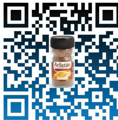
Código QR de Canciones Arlistán con el frasco de café. Elaboración propia.

La propuesta más viable para conseguir que las canciones estén en el frasco de café instantáneo Arlistán, es el agregado de un sticker con el código QR que sirva como nexo digital a las canciones, las que podrían escucharse en sus Smartphones a través de las aplicaciones multiplataforma Spotify o SoundCloud .