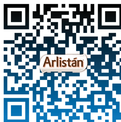
Código QR de Canciones Arlistán con el logo de la marca. Elaboración propia.