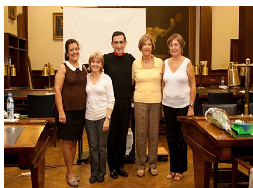
Algunos integrantes de la Cátedra DeCSA, FILO/UBA