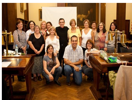
Foto con algunos asistentes al evento