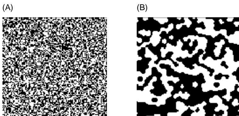
Figura 2: Efecto de un nivel de exigencia de 37.5% en el modelo De Schelling,

En la Figura 2 puede verse por ejemplo el resultado para un nivel de exigencia de 37.5% (es decir, tres de cada diez vecinos deben ser del mismo color). En (A) se encuentra la distribución inicial, y en (B) la configuración final luego de realizar todos los cambios que fueran necesarios hasta que la totalidad de los vecinos se encuentre a gusto en sus ubicaciones.