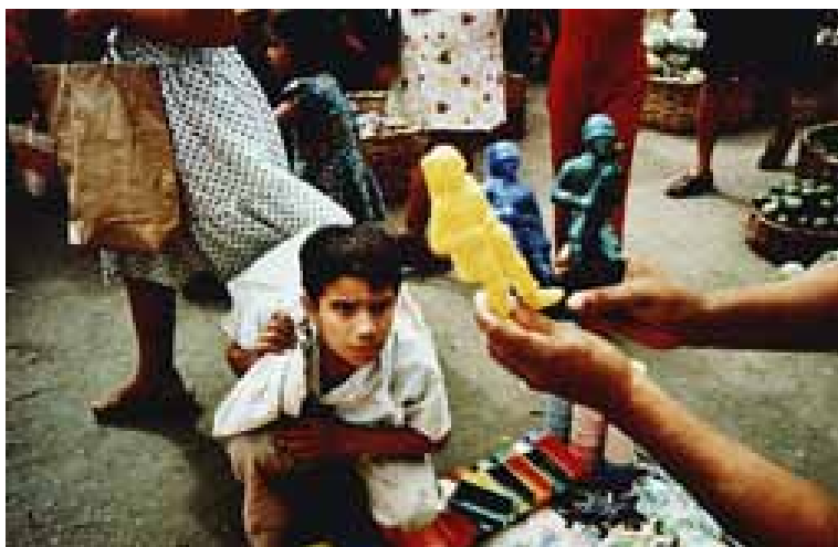
Susan Meiselas. Masaya, Nicaragua, 1979.