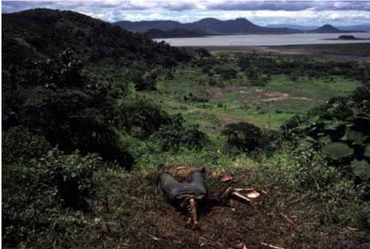
Susan Meiselas. Estelí, Nicaragua, 1979.