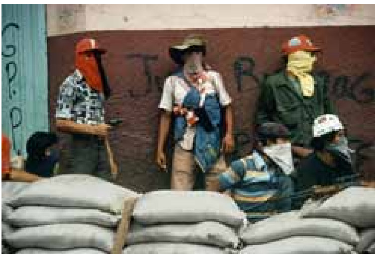
Susan Meiselas. Matagalpa, Nicaragua, 1979.