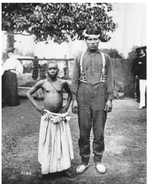
Imagen IV. “Comparación entre pigmeo de 25 años y patagónico de 16”. Exposición Universal de Saint Louis, EEUU, 1904.

Finalmente, las exhibiciones zooantropológicas representaban para una variedad de investigadores -como por ejemplo los miembros de la Sociedad de Antropología de París- un reservorio accesible de ejemplares humanos a los que aplicar sus estudios antropométricos, para abonar empíricamente sus teorías sobre las diferencias raciales.