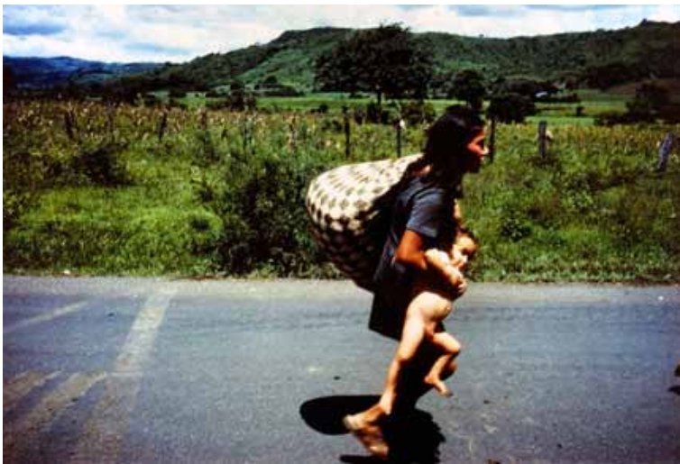
Susan Meiselas. Estelí, Nicaragua, 1979.