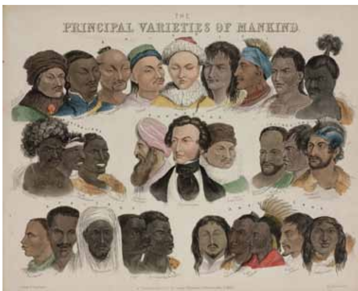
Imagen I. The Principal Varieties of Mankind , parte de la serie de posters populares "Illustrations of Natural Philosophy", publicada por James Reynolds, Londres, 1850.

La multitud de versiones acerca de las "variedades humanas" muestra la arbitrariedad de las clasificaciones que, paradójicamente, pretendían ser descripciones objetivas de divisiones existentes en la naturaleza. Siguiendo a Balibar, podemos decir que se trataba de "una proyección de las diferencias históricas y sociales en el horizonte de una naturaleza imaginaria". 6