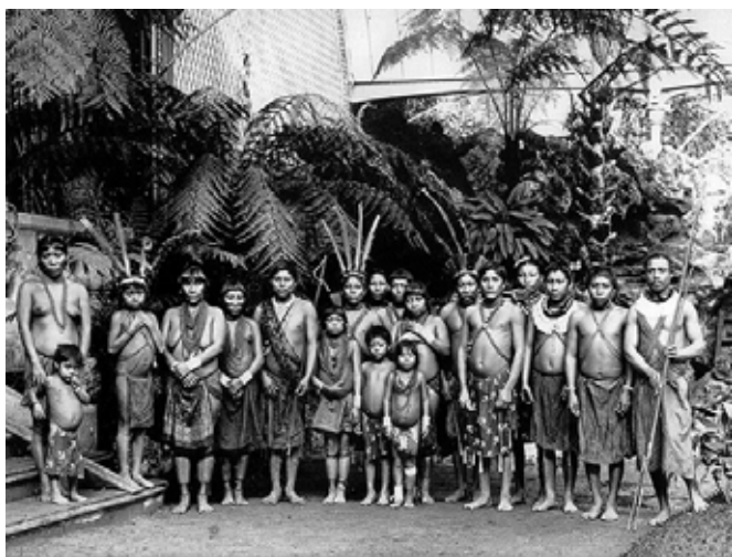
Imagen II. Retrato de Kalinas procedentes de

En los 55 años que median entre 1877 y 1931 tuvieron lugar en el Jardín 33 exhibiciones etnológicas, que incluyeron a representantes de pueblos de los cinco continentes.