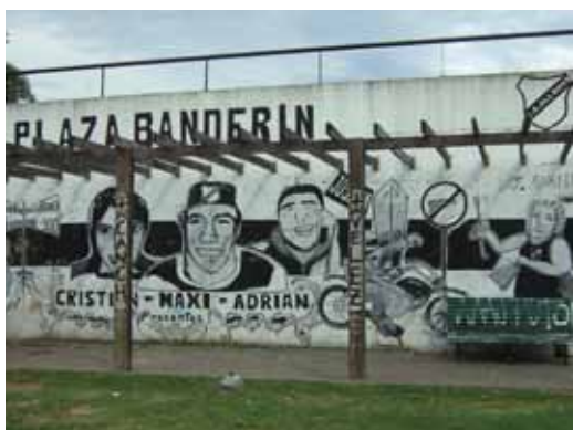
Mural de la plaza Udine

El mural de la plaza Udine en pleno barrio de Floresta en Buenos Aires, recupera desde el fútbol memoria por la reivindicación por el asesinato de tres jóvenes a manos de un ex miembro de la Policía Federal, en un episodio que se enmarca dentro de lo que los medios de comunicación denominan "gatillo fácil". El mural sitúa temporalmente el hecho con la figura de una mujer golpeando una cacerola y un motoquero en el obelisco, estas imágenes remiten a la temporalidad histórica que rodea el momento del crimen. Los jóvenes fueron asesinados mientras miraban por televisión imágenes del día 28 de diciembre del 2001, cuando se desataba la crisis que provocaría la renuncia del entonces presidente De la Rúa. Pero los sentidos sociales nunca son unívocos, de fondo un cartel que cruza un arma y simboliza la condena a la violencia, contrasta con ataúdes de los equipos rivales de All Boys, en esa toma solo se observa el cajón de Vélez y Nueva Chicago. El territorio sigue siendo un bastión a proteger por lo hinchas y la violencia un modo legítimo de sociabilidad entre hinchadas.