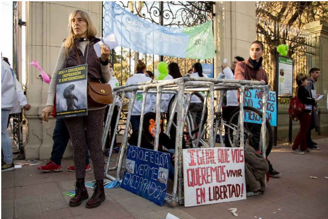
Recuperada de Facebook – Álbum Manifestación de Autoconvocados por el Cierre del Zoo. 29-07-2015.