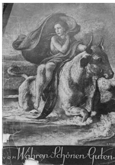
Image | Slika 3: Front cover | Naslovna platnica: Vom Wahren, Guten, Schönen (1947)

Unerwartetes und unmöglich Scheinendes zu entwerfen. Der geniale Mensch ist der Mensch der Eingebung, des schöpferischen Einfalls, der sich über das allgemeinmenschliche Maß unerreichbar erhebt. Dieser Mensch wird schöpferisch genannt, ein Wort, das erst im 18. Jahrhundert gebildet worden ist und seine Herkunft aus dem christlichen Begriff von Schöpfer und Schöpfung gänzlich vergessen hat. Man hat dieses Menschenbild den Homo faber genannt, den Menschen als Schmied, als Erfinder des Werkzeugs, dem alles, was ist, als