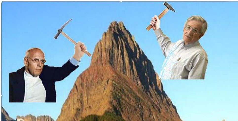
Imagen 3. Mineros del conocimiento .

Aquí tenemos a estos mineros del conocimiento: por una vía, Chomsky nos dio las bases para realizar la mayor abstracción sobre la lengua humana. Por otra vía, Foucault avanzó recopilando documentación con su Grupo de Información en las Prisiones y de allí nos regaló el broche terrible del siglo XX, Vigilar y Castigar :