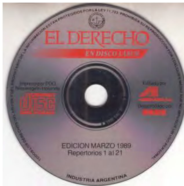
Imagen 2. El Derecho en disco láser .

Me permito seguir con mi itinerario personal: diez años después de aquel 1978 tuve el privilegio de participar como lingüista en la primera experiencia argentina de desarrollo de una base textual documental en disco láser. En 1988 aún no había difusión masiva de internet, la editorial El Derecho decidió digitalizar su impresionante acervo de fallos, así como textos fundamentales del cuerpo legal argentino, compilando entonces por primera vez legislación, jurisprudencia y doctrina. Todo ello en una impresionante masa de 350 megabytes. Cantidad que deja libre 3 cuartas partes de mi pen drive de ahora, sin embargo, era por entonces una empresa no realizada en el país, y solo conocida en pocos lugares del mundo. El proyecto en el aspecto informático fue llevado adelante gracias a un pionero a quien recuerdo hoy con agradecimiento: Joza Vrljicak: