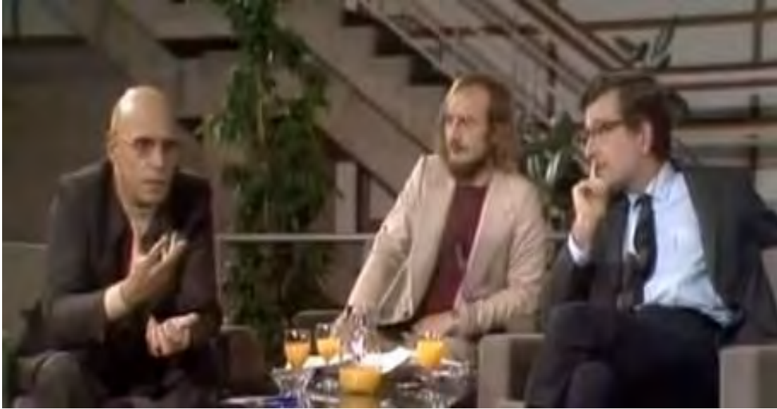
Imagen 1. Captura de pantalla del programa On Human Nature . Fuente: YouTube.

https://www.youtube.com/watch?v=n_AScyqFUCc .