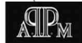
Asociación de Profesores de Portugués Misiones