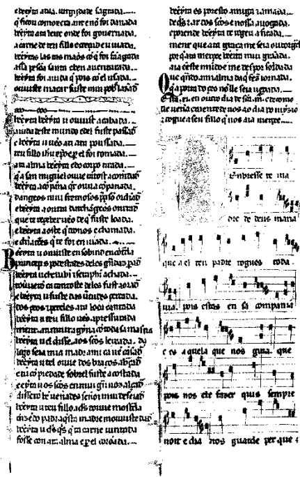
Figura 3. Folio 11v (E).

Siguiendo la clara mise en page del código E, en su magnífica edición crítica de las CSM del año 1986 Walter Mettman copió allí a pie juntillas su dispositio 11 en el manuscrito: