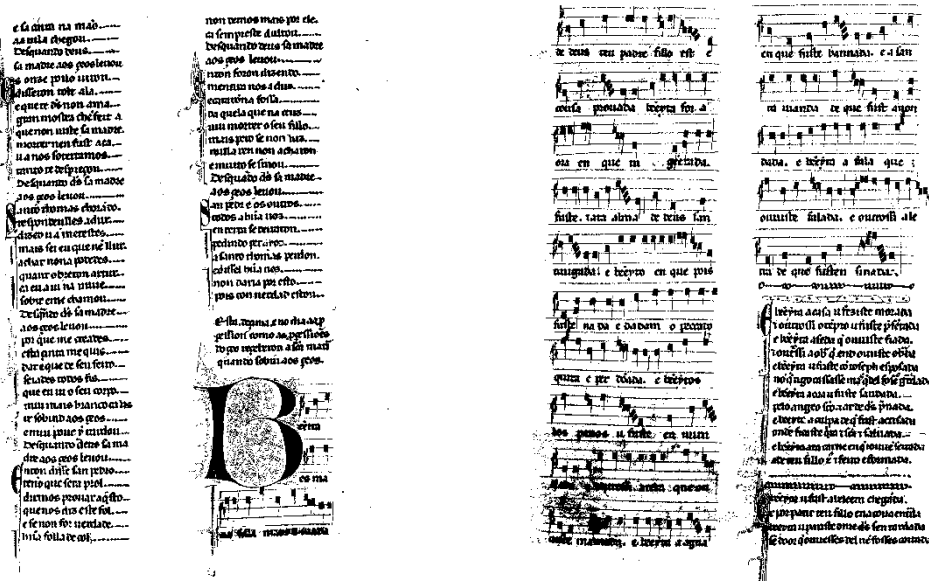
Figuras 1 y 2. Folios 10v-11r (E). Fuente: Anglés (1964) 10

para el inicio de la estrofa. La separación de estas se remarca además con el trazado de una línea horizontal curva que recorre la columna, como puede verse en las Figuras 1-3.