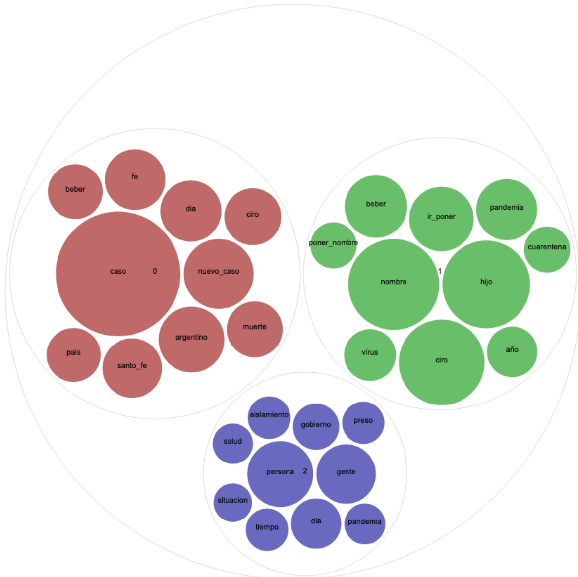
Figura 3. Tópicos de Argentina, 25 de abril de 2020. Elaboración propia.

destaca en el tópico verde, sino que invadió también los tweets con partes diarios con datos de nuevos casos y fallecidos (tópico color rojo teja).