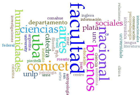
Figura 1. Nube de palabras sobre filiaciones y disciplinas a partir de los resúmenes de los expositores.

Un dato interesante sobre esta segunda edición de nuestro congreso es la procedencia de los participantes y su cantidad. Dejando de lado paneles y talleres, los números nos indican que, evidentemente, Argentina es el país más representado, con 86 ponencias. De todos modos, es interesante la distribución de los trabajos en el ámbito global. Los resultados son los siguientes: