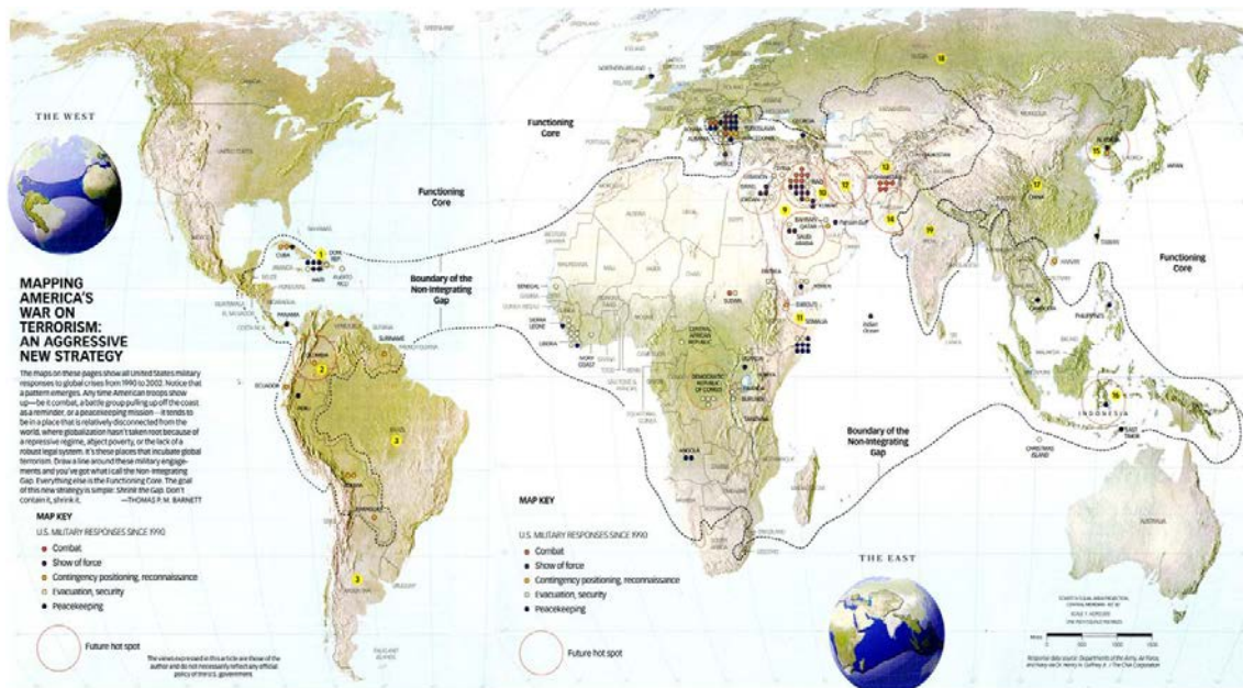
Figura 3. La guerra contra el terrorismo según el Pentágono (con núcleo funcional representado por estados y territorios bajo el control de las principales potencias mundiales).

Los mapas que acabamos de ver podrían también ser analizados en términos de recursos materiales. Digital no es sinónimo de inmaterial: al contrario, cualquier tecnología necesita –en la misma manera en la que lo planteaba Galeano– materias primas 6 . Es el caso por ejemplo del coltán, de donde se extrae el tantalio, un elemento poco común utilizado en la fabricación de los condensadores de los teléfonos móviles, y también necesario en las células fotovoltaicas, en la industria aeronáutica y de los materiales quirúrgicos, etc. El precio del coltán, que se extraía sobre todo en Brasil, Australia y Canadá, subió del 600% en pocos años y empujó las grandes empresas multinacionales a encontrar otras fuentes de aprovisionamiento. Y es entonces ahí que la bulimia digital llega en Congo, donde se encuentran el 80% de las reservas de coltán de toda África: